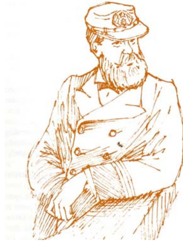
Uniforme de ingeniero c. 1879 ( Ilustración de Jorge Muñoz en: Tromben, Carlos. “ La Ingeniería Naval una especialidad Centenaria ”. Dirección de Ingeniería Naval, Valparaíso, 1989).