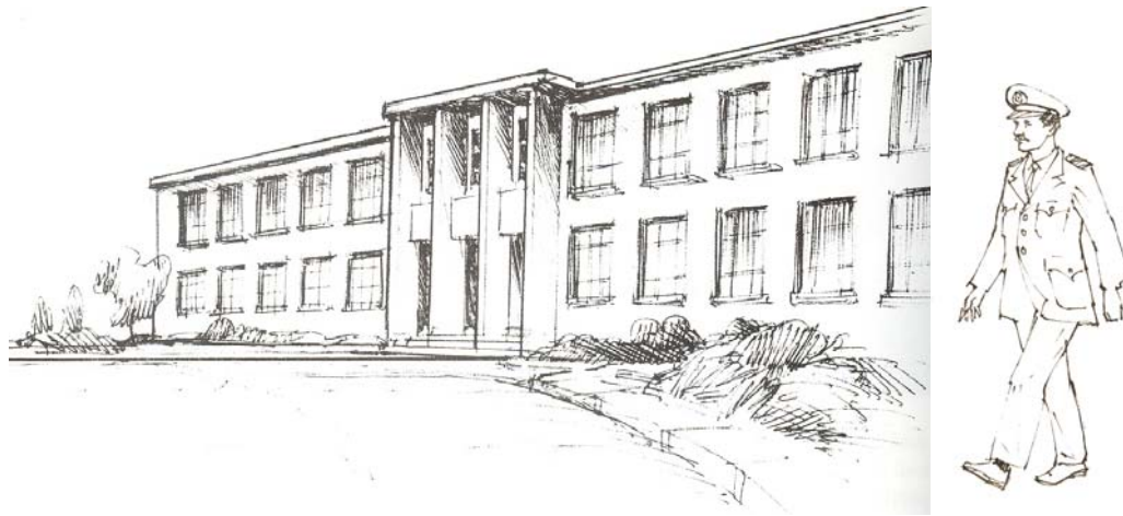
Izquierda: La Escuela de Ingeniería Naval. Derecha: El uniforme de servicio de clara influencia estadounidense. (En: Tromben, Carlos. “ La Ingeniería Naval una especialidad Centenaria ”. Dirección de Ingeniería Naval, Valparaíso, 1989).