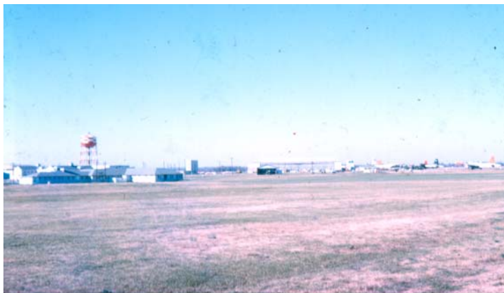
La Base Aeronaval de Memphis, Tennessee .c 1960, donde Existían varias Navy Service Schools a la que asistían miembros de la Armada de Chile.