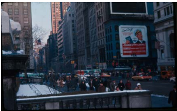
Nueva York .c 1960, la época de mayor auge de la formación de oficiales de la Armada de Chile en EE UU.

La educación en el ámbito de la ingeniería, desarrollada principalmente en Monterey, fue bastante significativa. Esto, debido al número de alumnos comparado con la cantidad de oficiales que tenía la Armada de Chile en esa época, a la variedad curricular y a los grados académicos obtenidos, ya que la mayoría de los participantes obtuvo el Magíster (Masters Degree), el de Ingeniero (Engineers Degree) que no es equivalente al chileno del mismo nombre, sino superior e incluso un Doctorado (PH.D). Asimismo, se realizaron períodos de entrenamiento o práctica combinados con cursos breves sobre el tema de la Administración de Astilleros Navales realizados en esas instalaciones industriales.