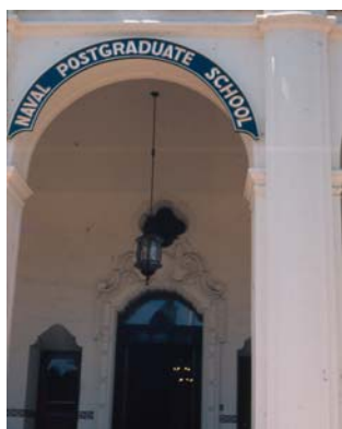
Acceso principal al NPGS c. 1970.

Los cuadros insertados en los anexos tienen como fuentes los archivos de la Dirección de Educación de la Armada y fueron preparados personalmente por el autor en 1996.