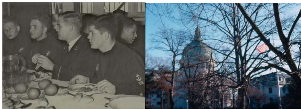
Izquierda: Alumnos de la Escuela Naval de Chile y de la USNA compartiendo socialmente en la primera c. 1960. (En: Merlet, Enrique. “ Escuela Naval de Chile, Historia, Tradición y Promociones ”. Valparaíso.2000). Derecha: La Academia Naval de Anápolis. (Fotografía del autor)

formación de oficiales para este país, es un tema bastante desconocido, como lo es, en general, el de la transferencia de conocimientos realizado por la Armada de los Estados Unidos en el período 1945-1975. Pese a que la cantidad de alumnos chilenos en estos centros de educación naval estadounidense mostrados en los anexos pueden parecer poco significativa, su efecto cuantitativo fue importante porque la profundidad y extensión de la educación entregada produjo cambios positivos que se han apreciado aún después del período estudiado en esta monografía.