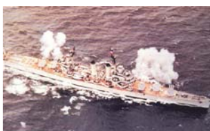
Un crucero clase Brooklyn, la más importante transferencia de posguerra a la Armada de Chile (Imagen en: Tromben, Carlos. “La Ingeniería Naval una especialidad Centenaria” . Dirección de Ingeniería Naval, Valparaíso, 1989).